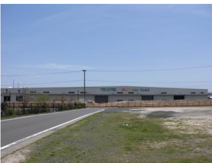
佐志浜埋立地に進出した ポラテック西日本（株）の工場